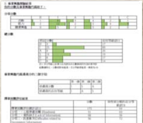
CI12013 網上平台及CI1報告示例